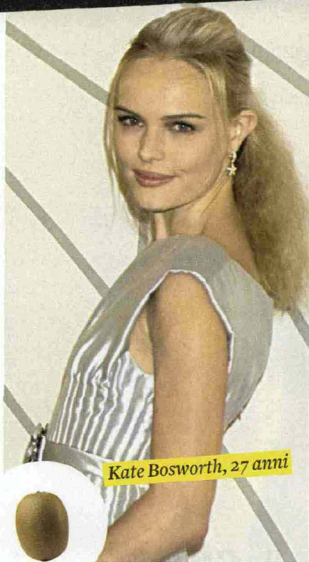
Kate Bosworth, 27 anni