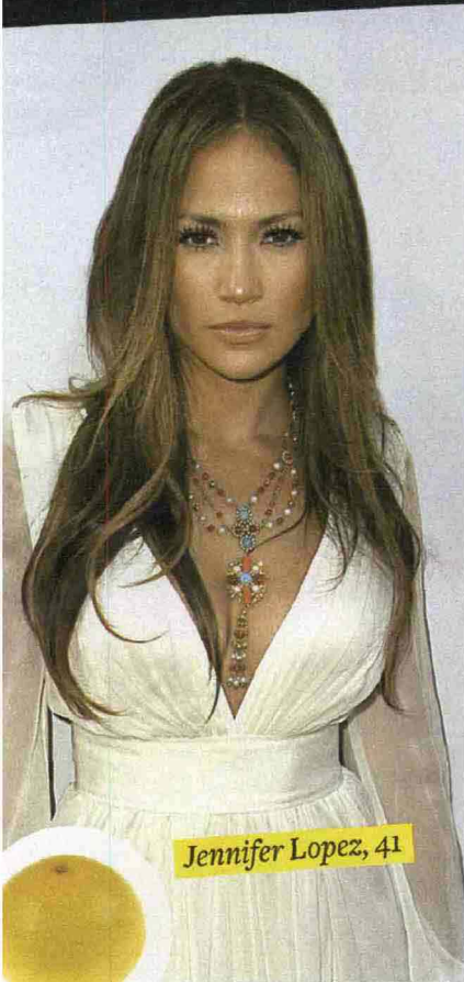
Jennifer Lopez, 41