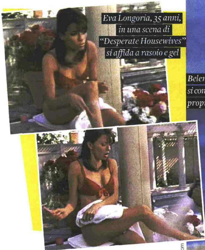
Eva Longoria, 35 anni, in una scena di "Desperate Housewives" si affida a rasoio e gel