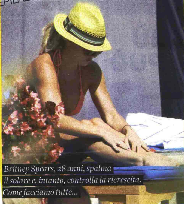
Britney Spears, 28 anni, spalma il solare e, intanto, controlla la ricrescita. Come facciamo tutte...