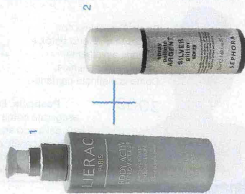
Still life Alessandro Colombo, Chic

2. LO SPRAY GLITTERATO Permette di vaporizzare in modo omogeneo e senza pasticcio, micro pagliuzze argentate che rendono l'epidermide molto seducente. Si usa anche sui capelli e va via con la doccia (Silver, Glitter Spray di Sephora, 7,90 euro).