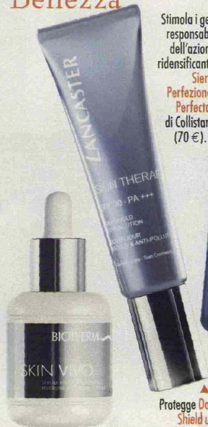
▲ Skin Vivo Siero reversivo anti età effetto tensore di Biotherm (75 €).

▶ Stimola i geni responsabili dell'azione ridensificante Siero Perfezione Perfecta di Collistar (70 €).