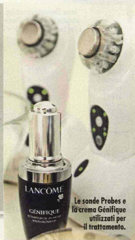
Le sonde Probes e la crema Génifique utilizzati per il trattamento.

Ritaglio stampa ad uso esclusivo del destinatario, non riproducibile.