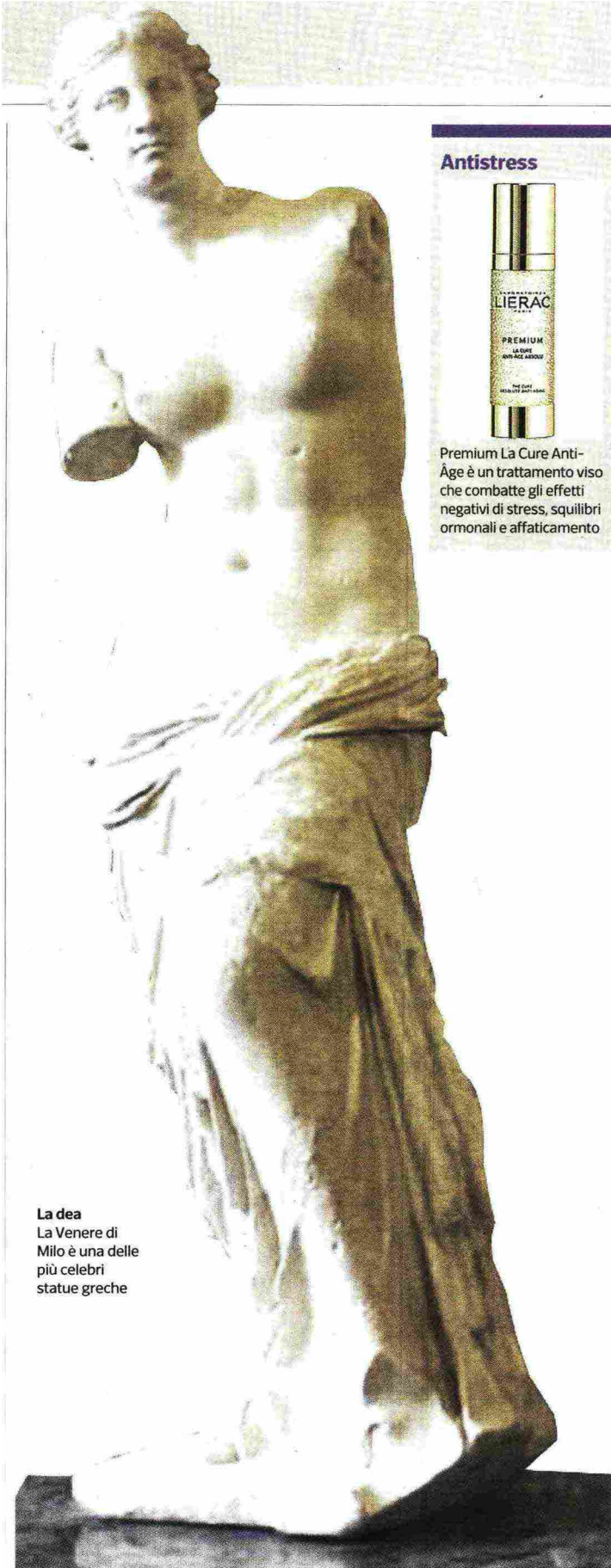
La dea La Venere di Milo è una delle più celebri statue greche